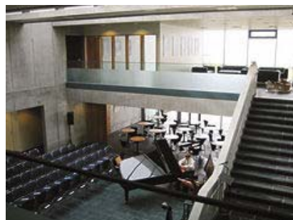
Nýheimar á Höfn: glæsileg mennta- og menningarmiðstöð sveitarfélagsins Hornafjarðar.